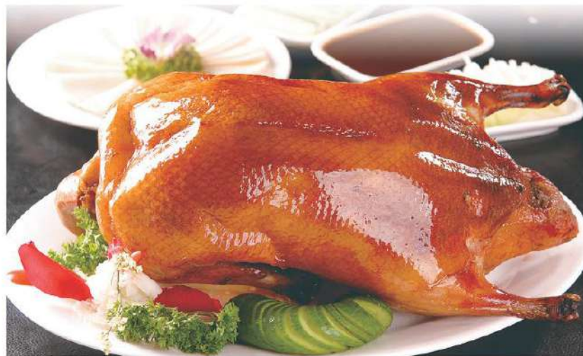
011 广东烤鸭 5.80€ / (1/4) 11.80€ / (1/2) Pato de Cantones

广东烤鸭是广东省传统的地方名菜，属于粤菜系。它以色泽红艳，肉质细嫩，味道醇厚，肥而不腻的特色，被誉为“天下美味”而驰名中外。色泽略黄，柔软淡香，夹卷其他荤素食物用，为宴席常用面点，更是家常风味小吃。