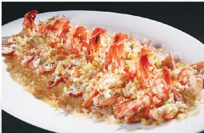
046 九节虾 (铁板, 酒炖, 生吃, 白灼, 蒜蓉) 2.50 € /只 Langostinos