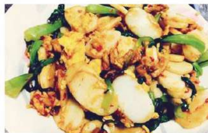
140 腊肉年糕 4.80 € /小 6.80 € /大 Pasta de arroz con carne ahumada