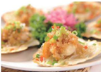
056 扇贝 (蒜蓉, 葱油) 2.00 € /份 vieira

海鲜其丰富的蛋白质、优质脂肪、各种微量元素，与肉类相比对人的营养和健康更为优越。更有许多海鲜食品，包括生翅、龙虾、海胆、海参、鱼翅、鲍鱼等等，因为富含钙、蛋白质等营养素，都有补钙、强精的功效。