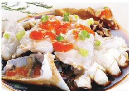
017 江蟹生 12.80 € /份 Ensalada de cangrejo con salsa especial