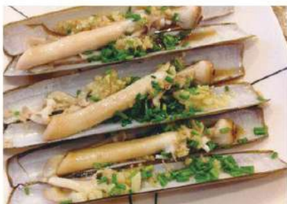
057 竹蛏 (铁板, 葱油, 滑炒) 2.00 € /份 Navaja