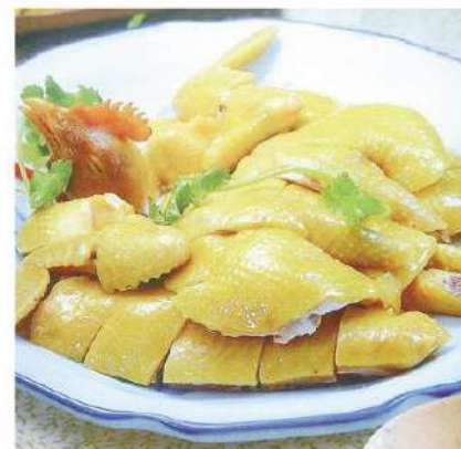
033 白切鸡 5.50 € /份 Pollo escalfado