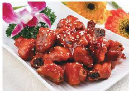
082 糖醋排骨 6.80 € /份 Costillas con salsa agnidulce