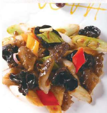
084 葱油海参 18.00 € /小 24.00 € /大 Pepino del mar salteado con puerros