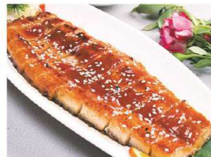
032 日式烤鳗 9.00 € /份 Anguila asada al estilo "Japón"