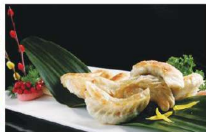
141 锅贴 4.00 € /小 8.00 € /大 Empanadillas a la plancha