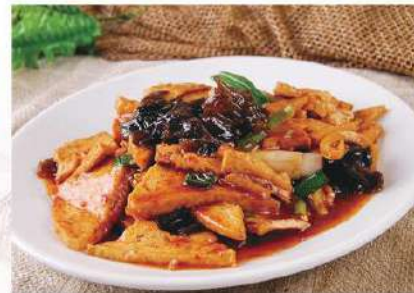
083 家常豆腐 6.80 € /份 Tofu de la casa