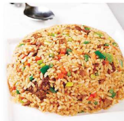
143 牛肉炒饭 4.80 € /小 6.80 € /大 Arroz frito con Ternera

图片仅供参考，实物以出品为准 The picture is only for reference, please make the object as the fuck