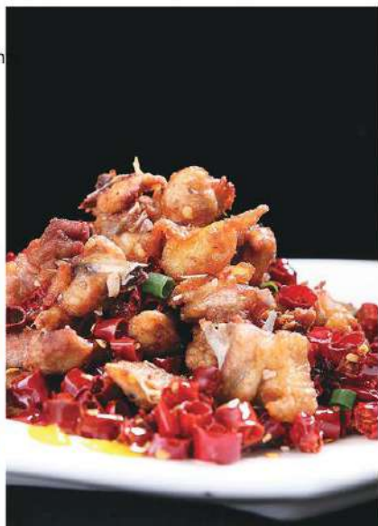
137 飘香辣子鸡 6.80 € /份 Pollo con salsa picante

图片仅供参考，实物以出品为准 The picture is only for reference, please make the object as the fuck