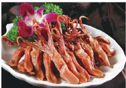
016 瓯式鸭舌 13,80 € /份 Lenguas de pato al estilo "Ou"