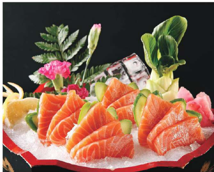
070 三文鱼 18.00 € /份 Salmón