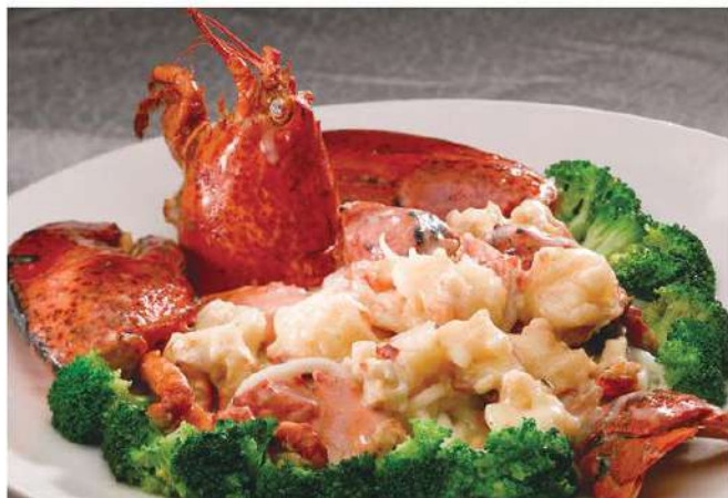
043 波斯龙虾 Langosta persa 24.00 € /份

海鲜其味鲜美，且能驱除体内各种有害物质，与肉类相比，对人的营养价值更高。为体强，更应多吃新鲜食品。生活工作，起居，运动，饮食，海鲜，还和等等，因为海鲜，其营养价值，营养价值，营养价值，营养价值。