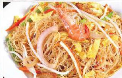
139 海鲜粉干 5.00 € /小 7.80 € /大 Sopa de fideo con mariscos