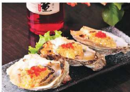
060 生蚝 (生吃, 烤) 2.50 € /份 Ostra