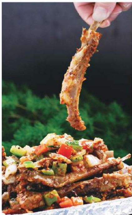
071 手抓羊排 13.80 € /份 Chuleta de cordero

热菜，是指有一定温度的菜式，如刚做好上桌时热热的可直接食用的菜，热菜可请服务人员从开始使用火进行对食材的加工开始。