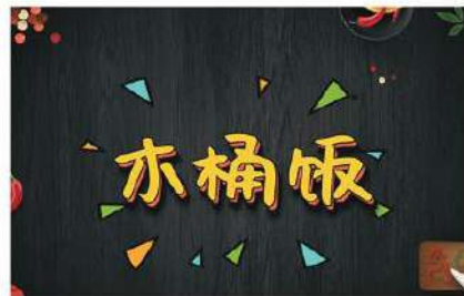
138 木桶饭 7.80 € /份 Arroz cocido en barril

主食是指传统上等粮食的主要食物(如：谷类、豆类及块茎类)，它既是人类日常饮食的重要组成部分，也是蛋白质、淀粉、脂肪、矿物质和维生素等的主要来源。