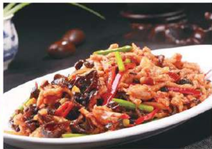
132 鱼香肉丝 6.80 € /份 Carne al sabor "yuxiang"