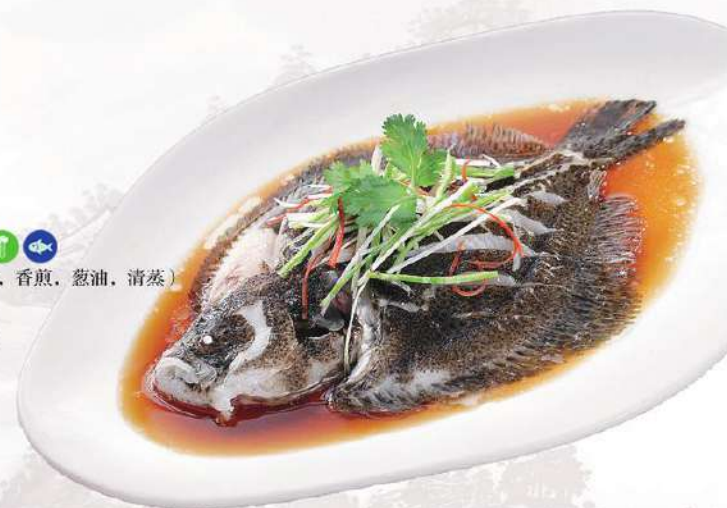
055 多宝鱼 24.00 € /份 (双味, 红烧, 香煎, 葱油, 清蒸) Rodaballo