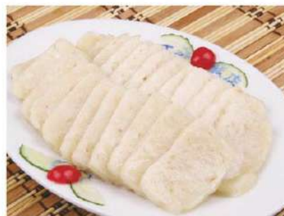
031 鱼饼 5.00 € /份 Pastel de pescado