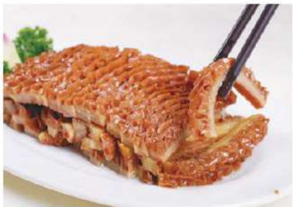
015 卤牛肚 5.20 € /份 Fiambre de callós de ternera

因为凉菜，有饮食安全和冷盘，凉菜的主要原料大部分是熟料，因此这道凉菜烹调方法有 很多种的差别，它的全部特点是：选料精道，口味丰富，脆嫩，爽口不腻，色泽艳丽，造 型整齐美观，味道和凉快。