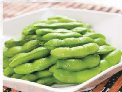
030 毛豆 3.50 € /份 Edamame