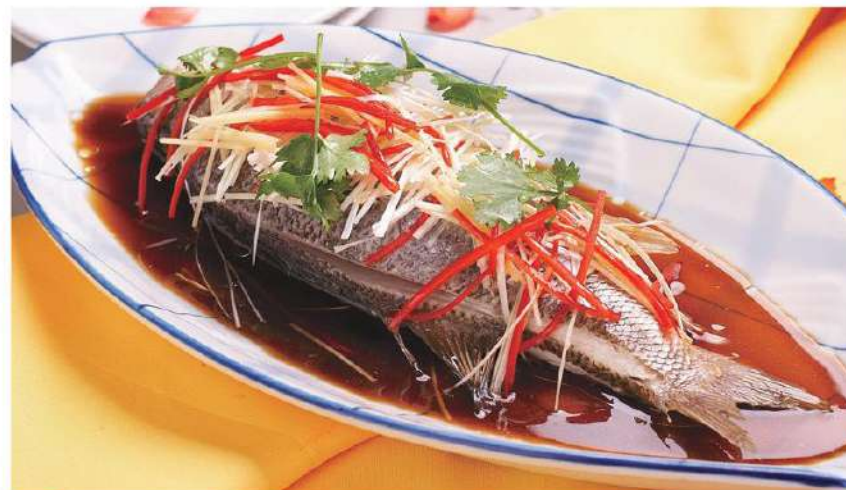
049 鲈鱼 Lubina 14.00 € /条 (香煎, 葱油, 红烧, 清蒸, 糖醋)