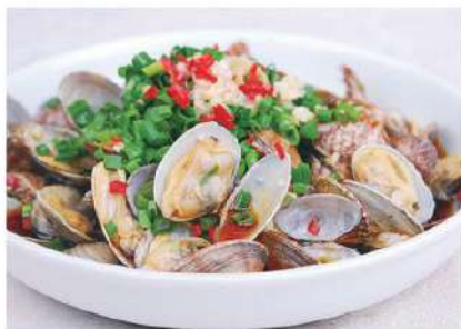
061 花蛤 (葱油, 芙蓉) 9.80 € /份 Berberecho