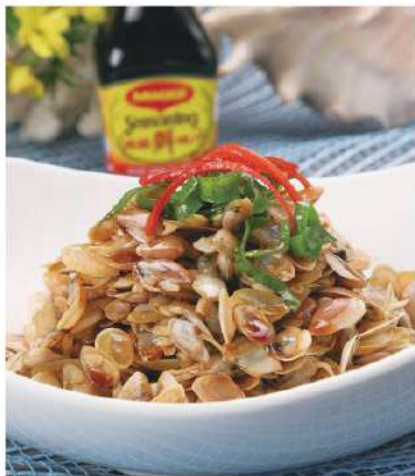
059 海瓜子 (滑炒, 生煎, 葱油, 大汤) 14.00 € /份 Tellinas