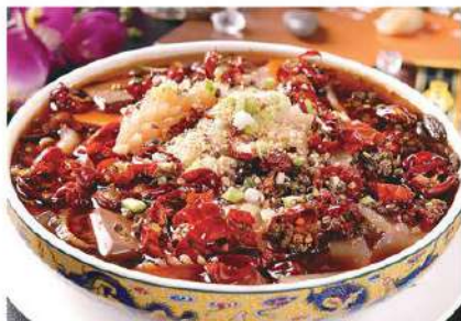
136 毛血旺 14.80 € /份 Sangre peluda