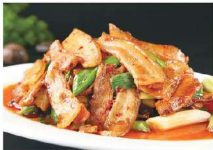
131 回锅肉 7.80 € /份 Cerdo al estilo "Huiguo" (picante)