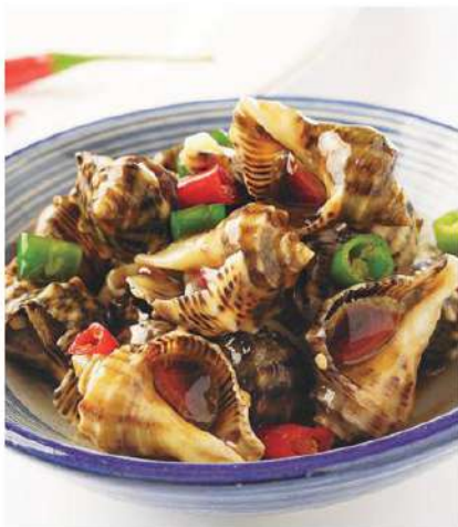
058 海螺 (盐水, 滑炒) 8.00 € /份 Cañailas