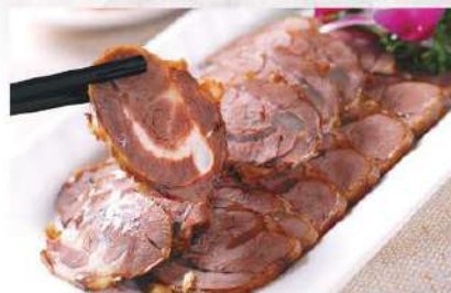
012 五香牛肉 5.00€ /份 Ternera especiada

广东烤鸭是广东省传统的地方名菜，属于粤菜系。它以色泽红艳，肉质细嫩，味道醇厚，肥而不腻的特色，被誉为“天下美味”而驰名中外。色泽略黄，柔软淡香，夹卷其他荤素食物用，为宴席常用面点，更是家常风味小吃。