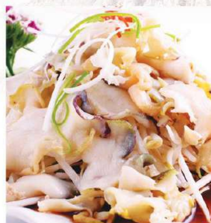
085 葱油螺片 9.80 € /份 Carne de caracol salteado con puerto